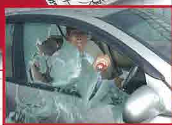
ガラス破碎先端部