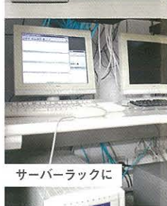
サーバーラックに