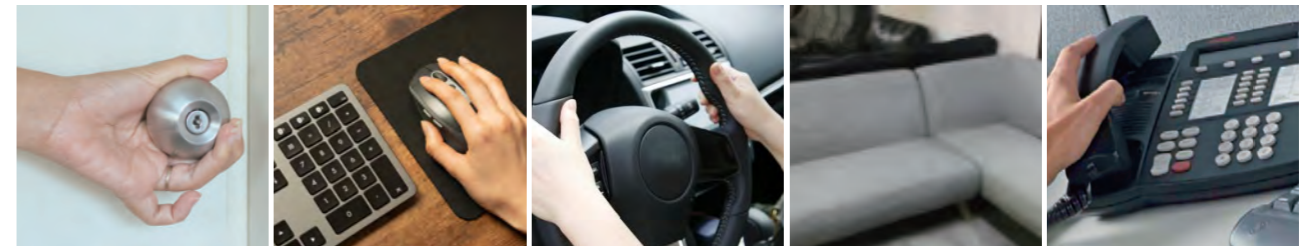
ドアノブ パソコン周り 車のハンドルなど ソファ 共有の電話機