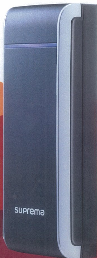
Smart IP Access Reader

さらに、RS485及びWiegandをサポートしているため、既存の入退システムへのスペックインも可能にしました。BioStarソフトウェアにより、セキュアでスマートなアクセスコントロールを提供します。