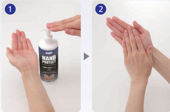
ワンプッシュで適量を手にとります

作業前の他、昼休み、業務後にお使いください。 水分を補う必要性を感じた時にもお使いください。