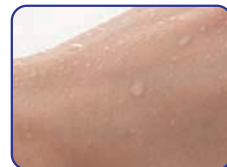
ハンドプロテクトをつけていない肌 ハンドプロテクトをつけた肌