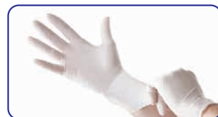
ラテックス手袋を使用の際もご使用いただけます

ゴージャー® ハンドプロテクトは、通常の使用においてはラテックスを痛めません。(手袋に擦り込み3時間放置後のJIS T 9107試験で確認)