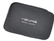
ラクニエ専用ポーチ付き

ご注意 ・本製品は、腰痛その他の疾患を治療するものではありません。 ・サポート力には個人差があります。 ・用途以外での使用はお止めください。ケガや重大事故、本製品の破損の原因となります。 ・以下に該当する方は、ご使用をお止めください。症状の悪化や異常の発生を招くことがあります。 [肩、胸、腰、ひざ等の装着部位に、ケガや血行不良その他疾患がある方。妊娠中の方。低体力の方。] ・引っ掛かりや巻き込まれが予想される場所では着用をお止めください。 ・本製品は、自身が持っている以上の力を発揮できるものではありません。本製品を装着して、過度に重たいものを持つことや、必要以上に腰に負担のかかる姿勢を取ることはお止めください。