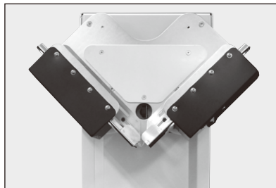
小サイズアタッチメント(オプション)