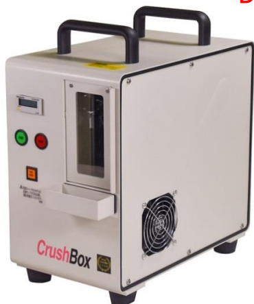
HA-50 V字破壊アダプタ付属

日本シェア90% DB-60PRO用SSDアダプタを新発売 DB-OP-60SSD