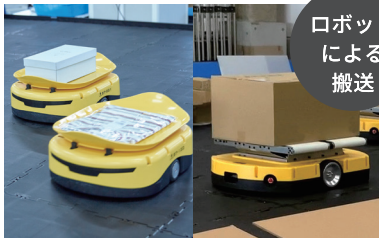
ロボットによる搬送